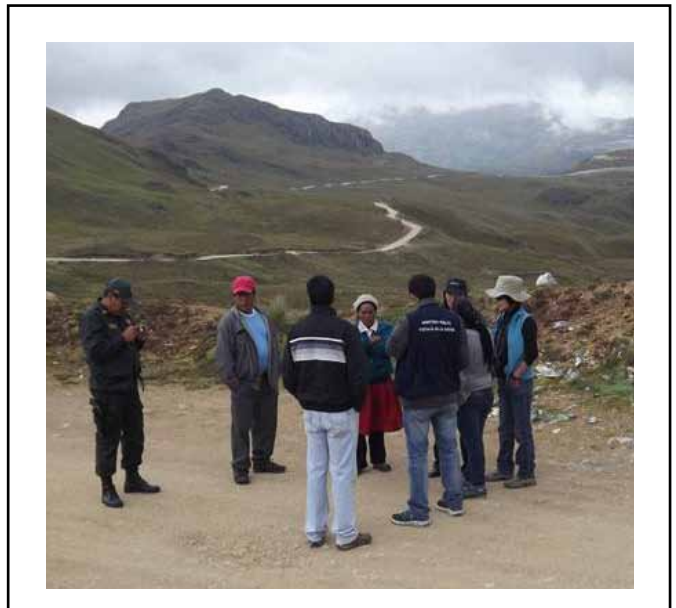
Diligencia del 5 de febrero de 2014. Se realizó sin ningún tipo de “amenaza” u “hostigamiento”.

Yanacocho continuará haciendo todo lo posible para evitar cualquier tipo de confrontación, proteger la seguridad de las personas y garantizar que sus derechos de propiedad y la Ley sean respetados.